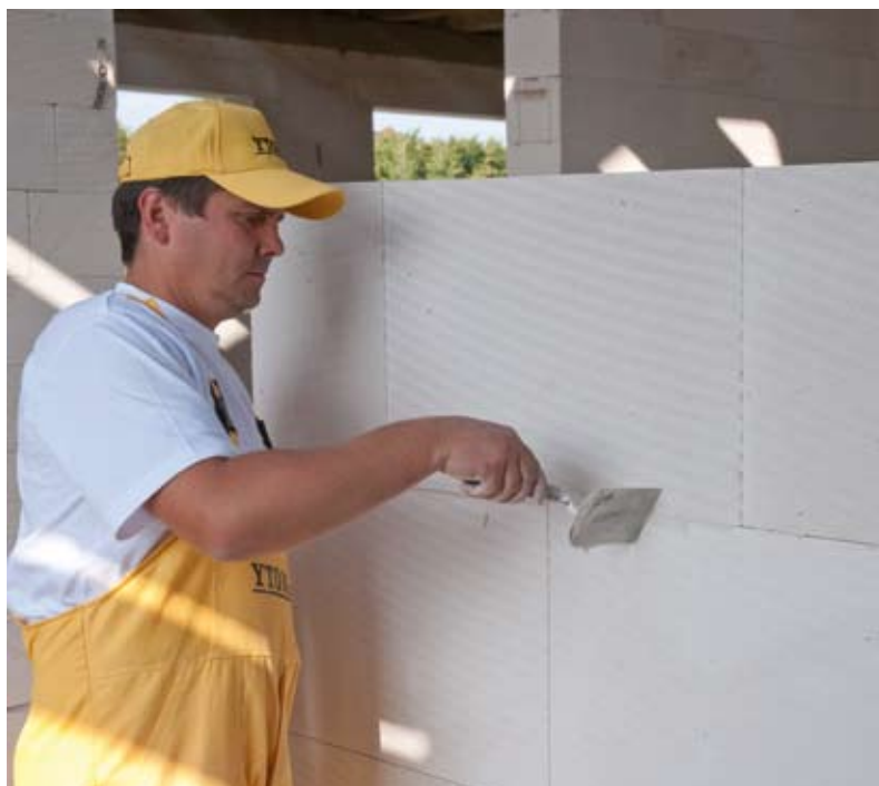
YTONG INTERIO blokeliai – tai tvirta ir lygi siena